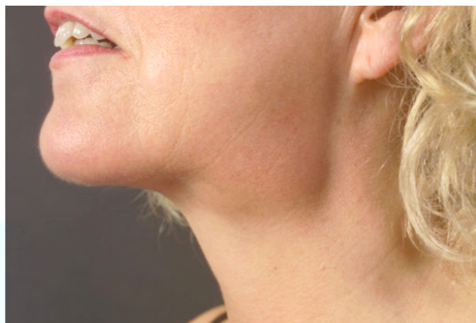
Afbeelding: Zwelling van de onderkaaksspeekselklier door een gezwel.

Een stevige, niet pijnlijke zwelling onder de kaak kan duiden op een gezwel in de speekselklier. Een gezwel in de onderkaaksspeekselklier kenmerkt zich door een bobbel onder de kaakrand, nabij de kaakhoek. In ongeveer 65 % van de gevallen is het een goedaardig gezwel. Kwaadaardige gezwellen van deze speekselklier komen dus voor, maar minder vaak dan goedaardige gezwellen.