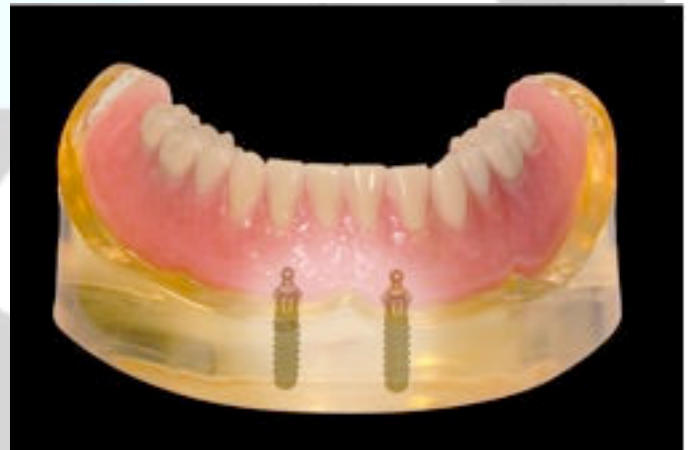
Afb.4: Schematische afbeelding van implantaten met drukknoppen en de prothese.