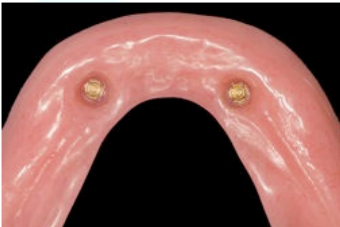
Afb.2a. In de prothese zitten ook drukknoppen.