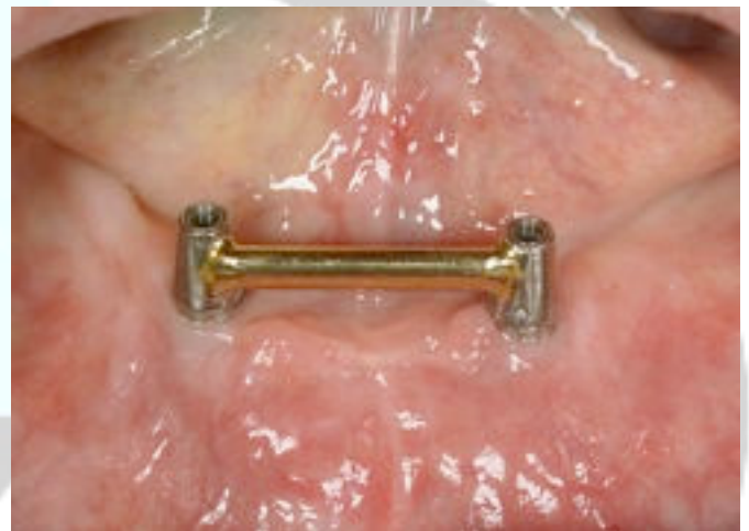
Afb.1a: Twee implantaten verbonden door een staafconstructie.

De constructie op implantaten wordt ongeveer twee tot drie maanden na het plaatsen gemaakt omdat er dan een goede hechting is tussen het implantaat en het kaakbot.