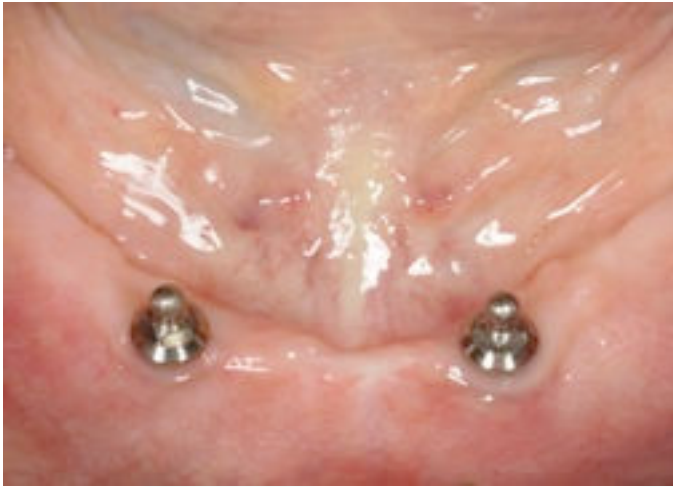
Afb.2a: Twee implantaten met drukknoppen.

Patiënteninformatie van de Nederlandse Vereniging voor Mondziekten, Kaak- en Aangezichts chirurgie (MKA), de wetenschappelijke vereniging van kaakchirurgen in Nederland Zie: www.kaakchirurg.nl