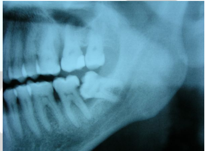
Afb.1: Cariës door gestoorde doorbraak van een verstandskies.

Klachten aan een verstandskies zijn de belangrijkste reden om ze te laten verwijderen. Dat gebeurt nadat de acute fase van de ontsteking tot rust is gebracht. Maar je kunt ook proberen klachten te voorkomen door verstandskiezen voortijdig preventief te laten verwijderen. Dat gebeurt dan het liefst voor het 25e levensjaar, omdat de genezing dan beter verloopt.